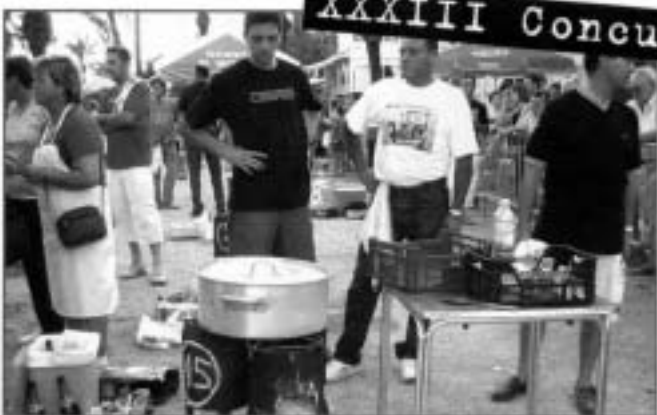
XXXIII Concurs d'All cremat