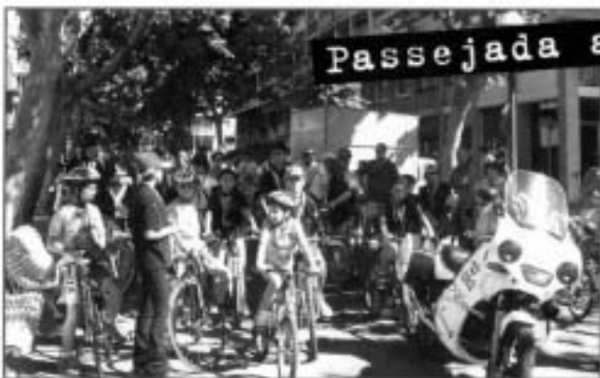
Passejada amb bicicleta