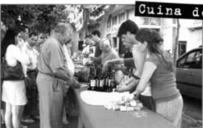
Cuina de Pescadors