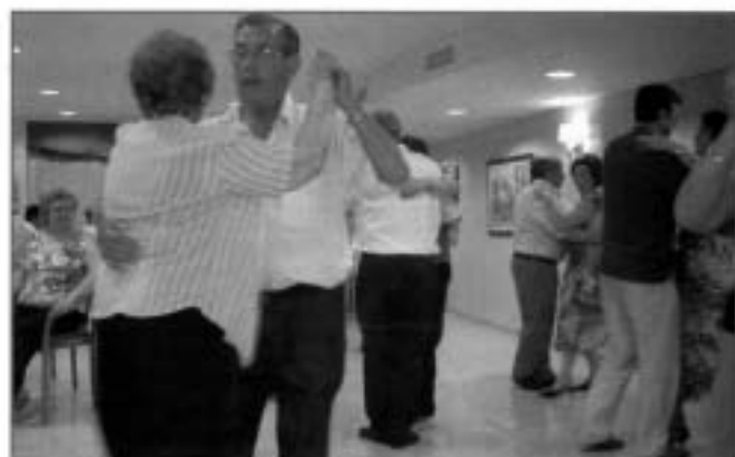
Sopar Ball d'Estiu