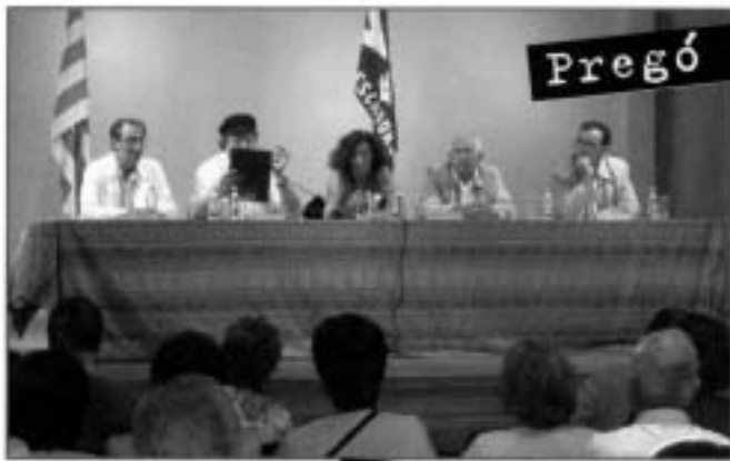
Pregó de Festes